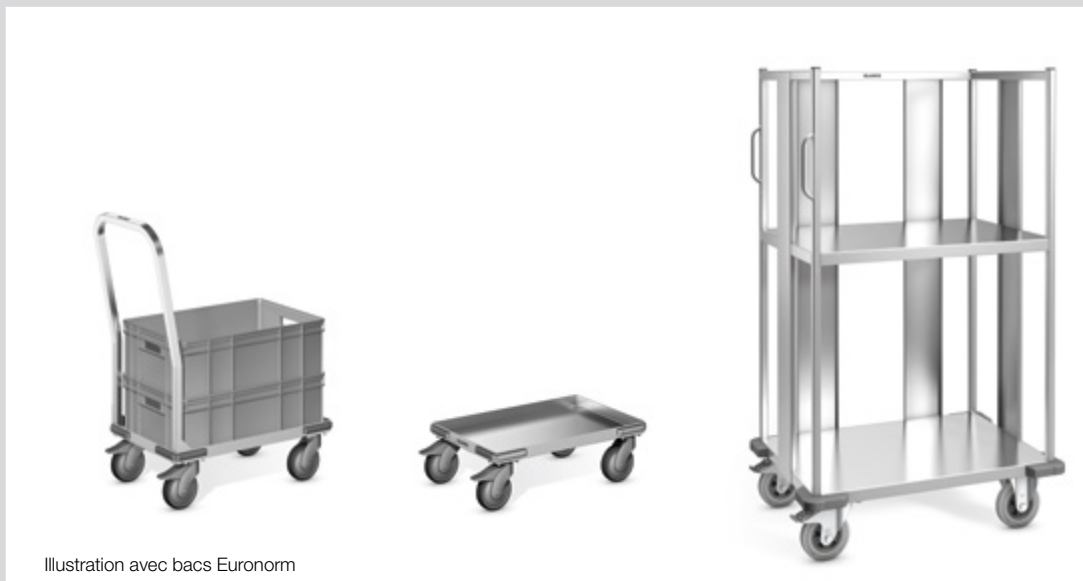
Illustration avec bacs Euronorm