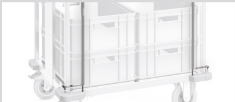
TWE 6 x 4 avec sécurité de poussée des deux côtés en option