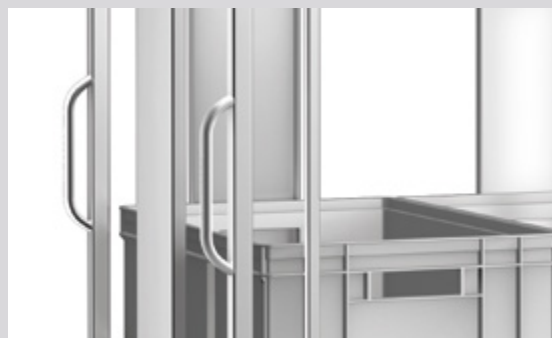
TWE 6 x 4 avec poignée de poussée ergonomique